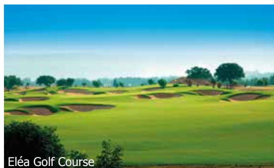
Eléa Golf Course

ATTENTION: Nombre de places limités aux conditions ci-dessous. Si la classe de réservation calculée n'est plus disponible nous nous réservons d'appliquer un supplément de vol. vb412